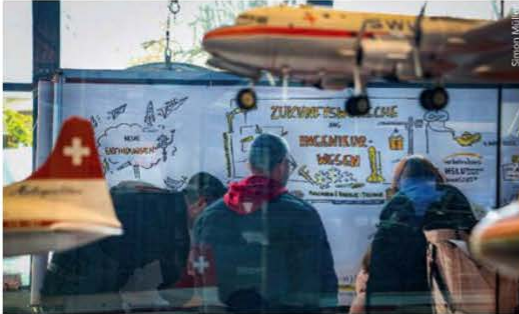
Visuelle Grafik von spannenden Projekten der Hochschule Luzern, ausgestellt im Verkehrshaus der Schweiz.