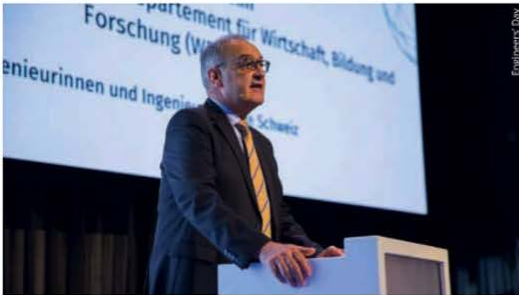
Bundesrat Guy Parmelin am Netzwerkevent des Auftakt-Engineers'-Day am 17. Februar.

Ohne Ingenieurinnen und Ingenieure kein Handy, kein Zug, Tram oder Auto, keine Gebäude, keine Stromversorgung und kein Office – ob zu Hause oder physisch im Büro. Ingenieurinnen und Ingenieure leisten für den Wohlstand der Schweiz einen essenziellen Beitrag. Davon konnten sich die Besucherinnen und Besucher des Engineers' Day 2022 am 4. März selbst ein Bild machen, virtuell in 19 Workshops und Webinaren oder vor Ort in Städten in allen drei Landesteilen.