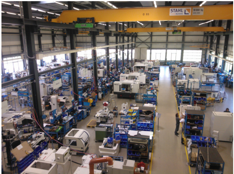
23.04.2015: Besichtigung Firma Fritz Studer AG, Steffisburg

Nach der Winterpause arbeitet der Vorstand intensiv an der Vorbereitung der Hauptversammlung sowie an der Fertigstellung des Jahresprogramms. Vor der HV wird es einen spannenden Vortrag über „TESLA Motors“ geben. TESLA stellt elektrische Premium Wagen her. Dieses Jahr ist die Sektion Bern Patronatspartner der „Türöffner-Events 2016“. Es handelt sich hierbei um eine Reihe von Veranstaltungen, die durch energie-cluster.ch