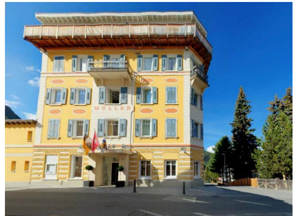
Hotel Müller im Zentrum von Pontresina

Um die Vorfreude auf unsere Wanderferien etwas zu steigern in der Folge noch ein paar Höhepunkte die wir je nach Kondition, Zeit und Wetter erleben dürfen.